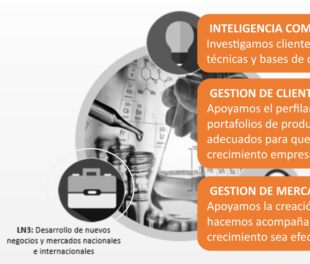
LN3: Desarrollo de nuevos negocios y mercados nacionales e internacionales

INTELIGENCIA COMPETITIVA Investigamos clientes y mercados con técnicas y bases de datos efectivas.